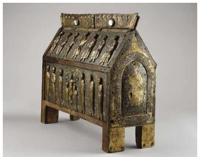
Grande châsse de Sainte Fauste Limoges, milieu du XIII e s. Cuivre doré, gravé et émail champlevé H. 45 ; l. 52 ; prof. 19,4 cm Paris, Musée de Cluny-Musée national du Moyen Âge

Cet événement s'inscrit dans le cadre de l'opération nationale initiée par le Ministère de la Culture "La Culture près de chez vous". Elle vise à faciliter les prêts d'œuvres entre les musées nationaux et territoriaux. Le musée d'Issoudun a souhaité accueillir ces objets uniques en raison de leur provenance, la commune de Séгры, proche d'Issoudun ainsi qu'en raison de leurs caractéristiques iconographiques, historiques et techniques exceptionnels.