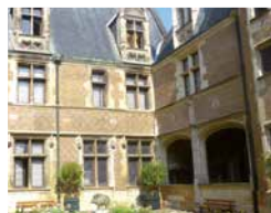
MUSÉE DU BERRY HÔTEL CUJAS 4 rue des Arènes Tél : 02 48 70 41 92