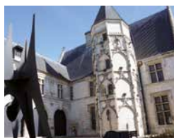
MUSÉE ESTÈVE HÔTEL DES ÉCHEVINS 13 rue Edouard Branly Tél : 02 48 24 75 38