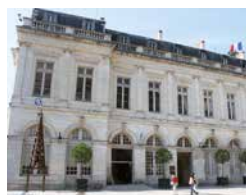
MUSÉE DES MEILLEURS OUVRIERS DE FRANCE Place Etienne Dolet Tél : 02 48 57 82 45

www.ville-bourges.fr/site/musees musees@ville-bourges.fr