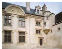
MUSÉE DES ARTS DÉCORATIFS HÔTEL LALLEMANT 5 rue de l'Hôtel Lallemant Tél : 02 48 70 23 57