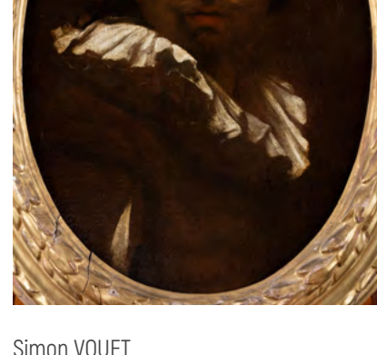
Simon VOUET Autoportrait Huile sur toile Collection Motais de Narbonne

- Vendredi 30 novembre à 18h30 Musée des Beaux-Arts