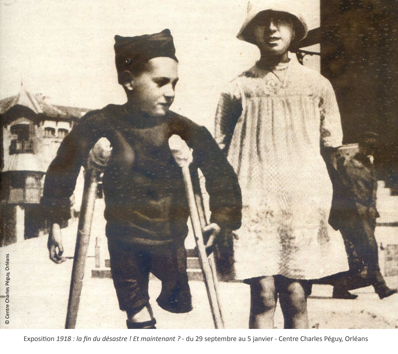
Exposition 1918 : la fin du désastre ! Et maintenant ? - du 29 septembre au 5 janvier - Centre Charles Péguy, Orléans