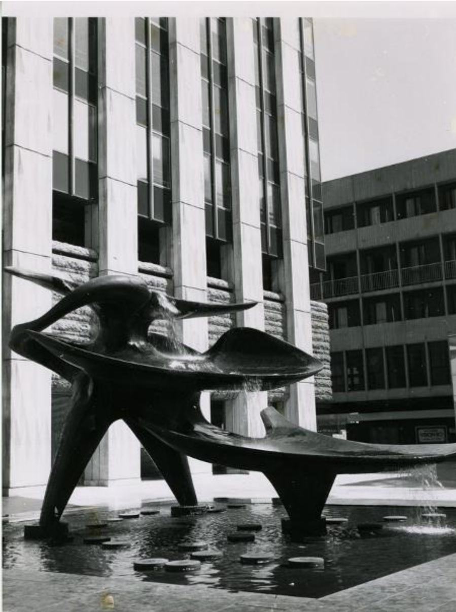
Louis Leygue, Les Corolles du jour

A partir de certaines œuvres de l'artiste, le public découvrira les jeux de volumes, les effets produits par la lumière, le travail de la matière.