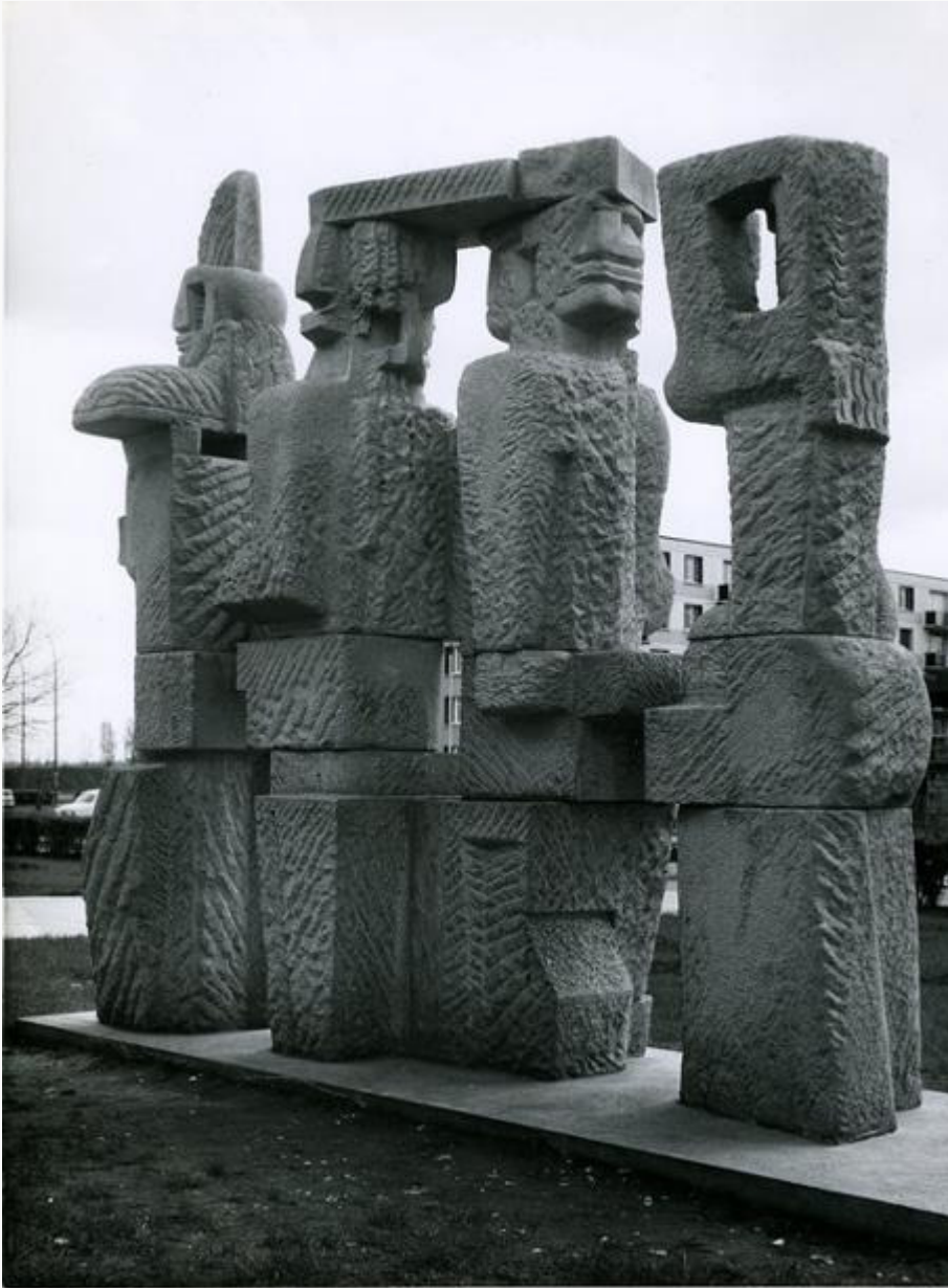
Louis Leygue, Le Cortège

La reproduction à l'échelle monumentale répond à une commande passée à l'artiste en 1967 pour la Cité Floréal à Saint-Denis. La réalisation en pierre dure appelle la schématisation des volumes et les plans anguleux.