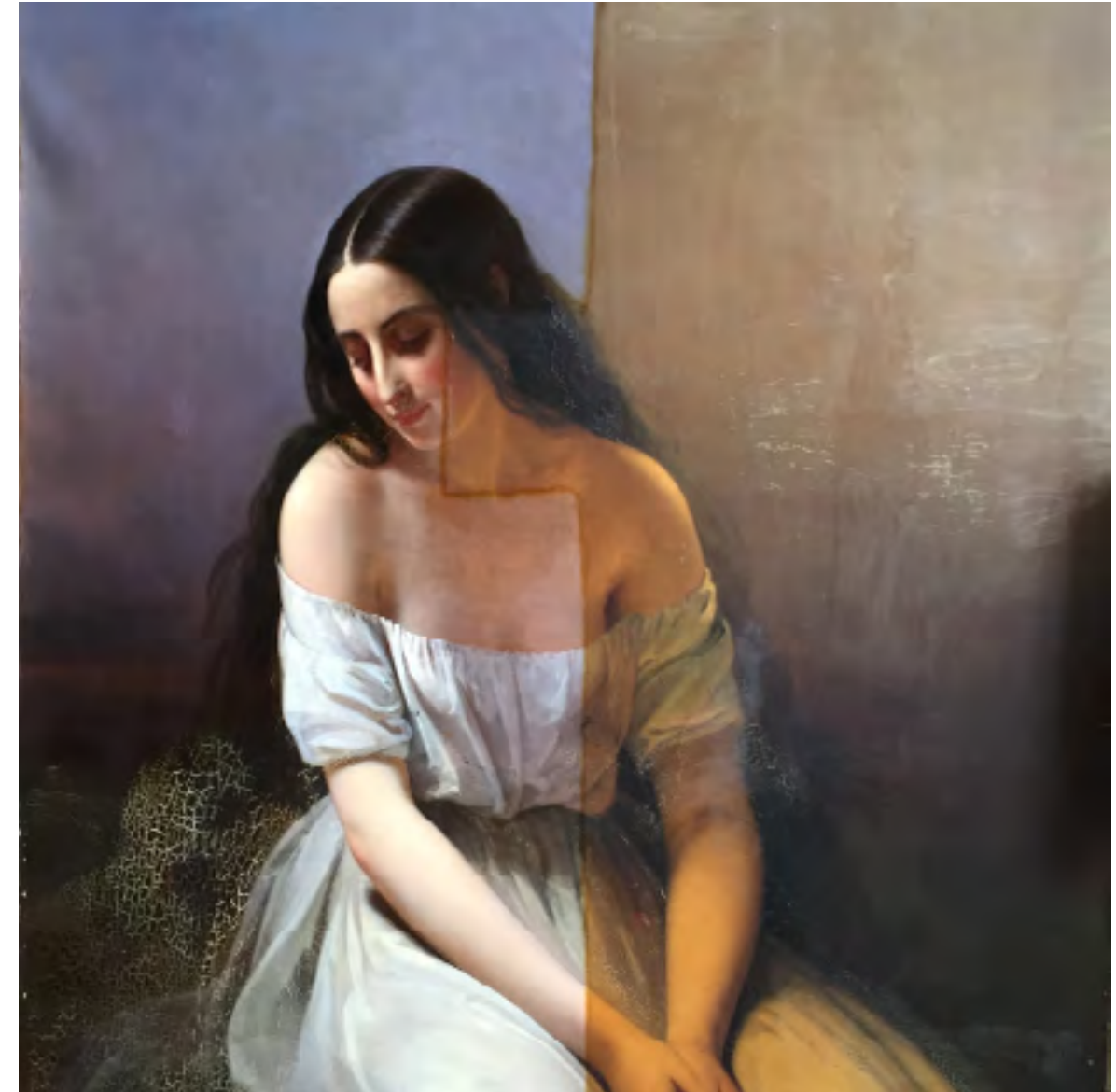
Aimée Brune-Pagès Femme à genoux (en cours de restauration)

Vendredi 20 mai , 18h30, musée des Beaux-Arts d'Orléans