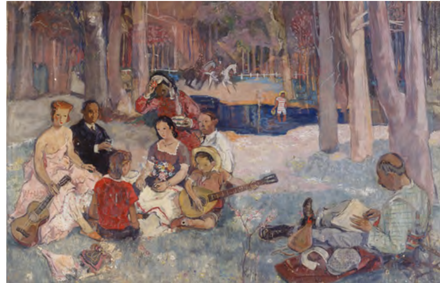
Roger Bezombes Le concert champêtre

auditorium du musée des Beaux-Arts, entrée gratuite