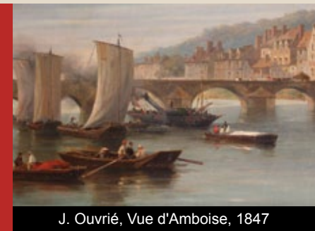
J. Ouvrié, Vue d'Amboise, 1847

Après le couloir, dans le vestibule : la Vue d'Amboise par Justin Ouvrié (1847), animée par la présence de bateaux navigant sur le fleuve ; la surprenante Vue nocturne d'Amboise d'Auguste Regnier, 1845 témoignant d'une vision romantique et idéalisée d'Amboise ; les pistolets du duel de Pouchkine.