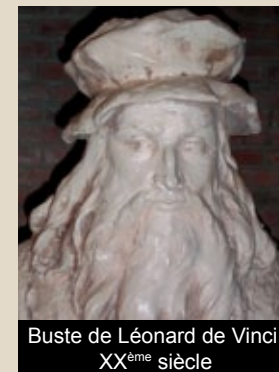
Buste de Léonard de Vinci, XXème siècle

Cette salle est consacrée au génial artiste florentin venu se retirer au Clos Lucé où il meurt le 2 mai 1519.