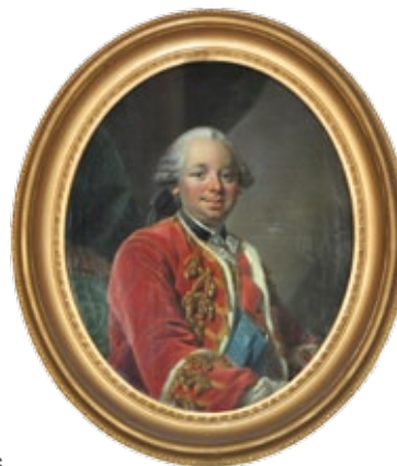
Portrait du Duc de Choiseul, XVIIIème siècle