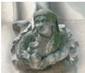
Détail architectural extérieur

L'hôtel passe ensuite de mains en mains. En 1764, le duc de Choiseul, puissant ministre et riche gouverneur de Touraine qui a reçu de Louis XV le duché-pairie, en fait le siège de sa justice seigneuriale.