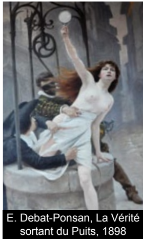
E. Debat-Ponsan, La Vérité sortant du Puits, 1893

Décorée d'une très belle cheminée aux initiales et aux armes des époux Morin, cette salle est une des plus belles du musée.