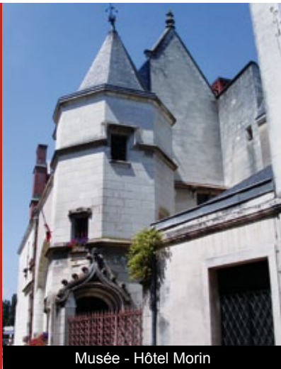
Musée - Hôtel Morin