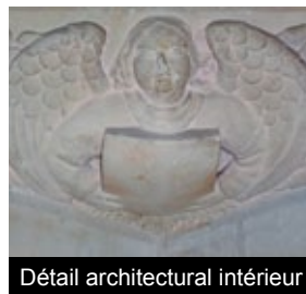
Détail architectural intérieur

L'état de délabrement dans lequel se trouve le bâtiment étant important, des restaurations sont entreprises à partir de 1891.