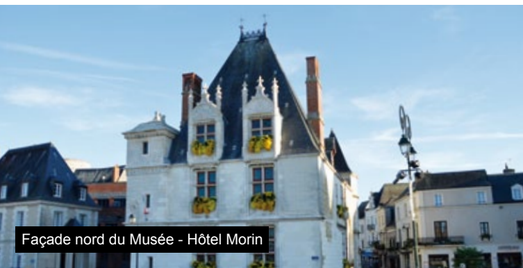
Façade nord du Musée - Hôtel Morin

Dès lors, ce logis est désigné sous le nom de « Palais Ducal ». En 1786, il passe au duc de Penthièvre, puis à sa fille la duchesse d'Orléans.