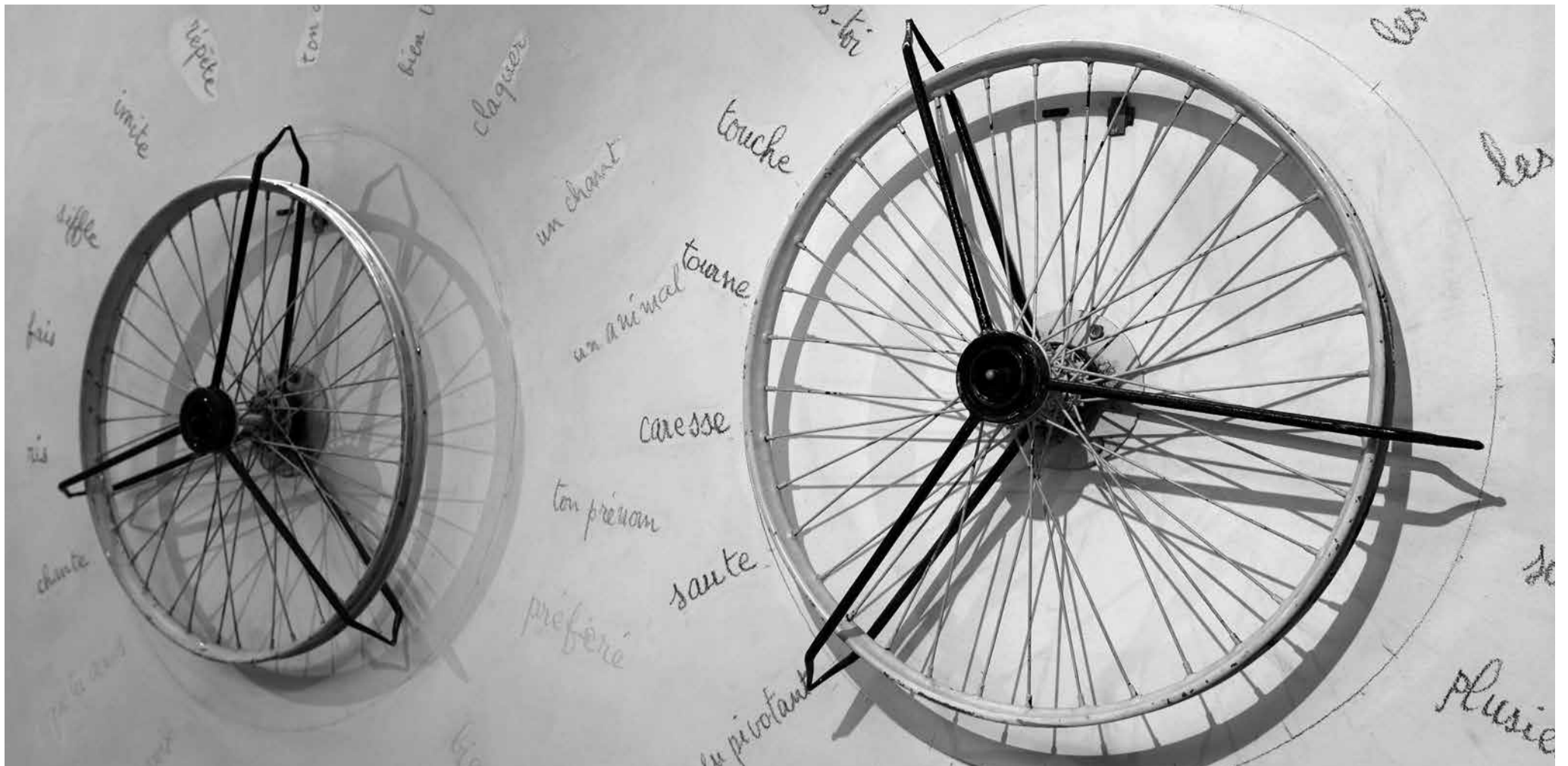
Robert Filliou, Danse poème aléatoire collectif, 1962