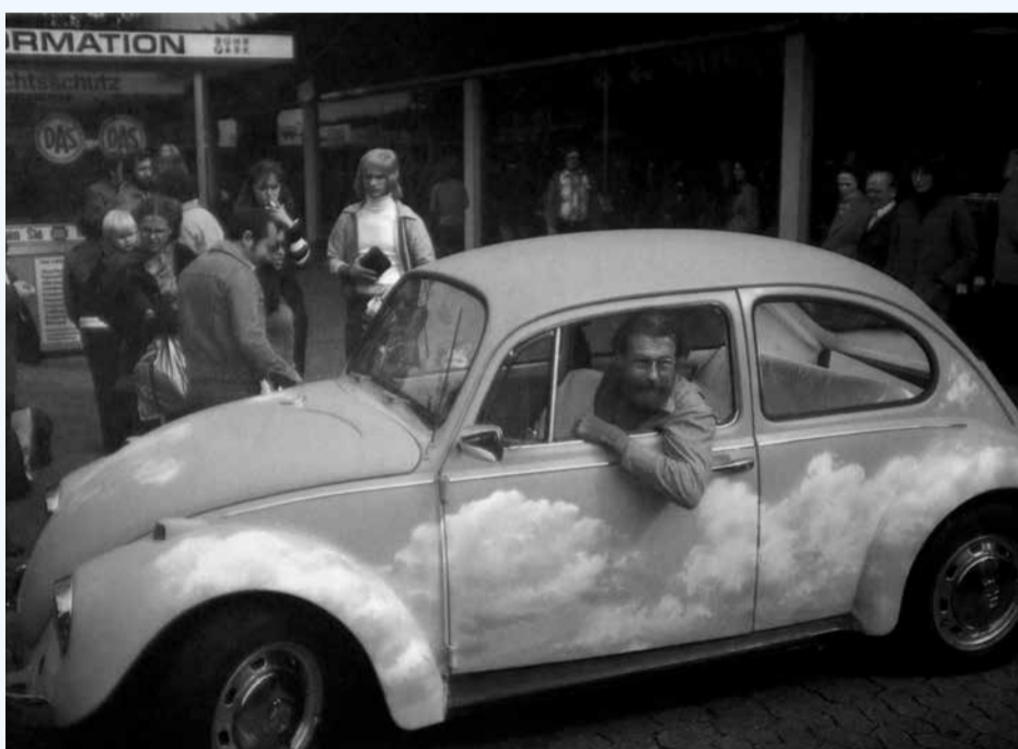
Geoffrey Hendricks, Sky Car, 1979

À L'OCCASION DE CETTE EXPOSITION, LES VISITEURS ONT LA TÊTE DANS LES NUAGES DE GEOFFREY HENDRICKS.