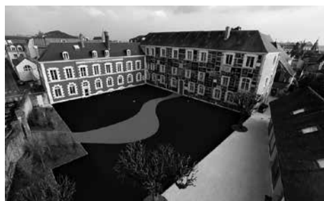
Cour du doute et du « Mur des Mots » de Ben, 1995-2013