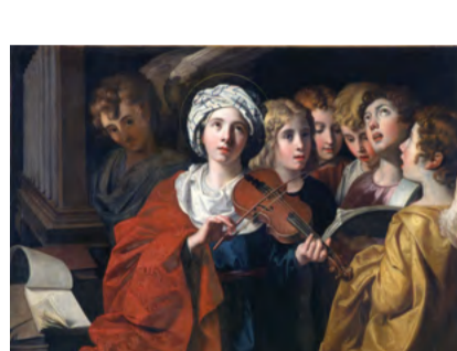
École bolonaise Sainte Cécile concertant avec les anges Huile sur toile

- Dimanche 24 février de 15h Musée des Beaux-Arts