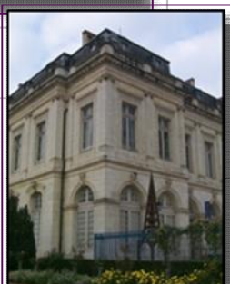
Musée des Meilleurs Ouvriers de France