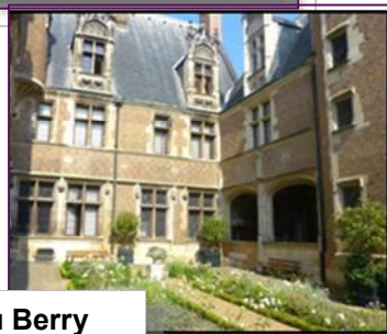
Musée du Berry