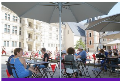
Salon de thé éphémère

En supplément du droit d'entrée : Adulte : + 5 € / Enfant (6 - 17 ans) : + 2 € Sur réservation au 02 54 90 33 32 Durée : 2h00